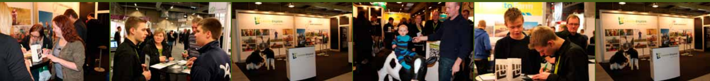
Tekst og foto: Jesper Hall